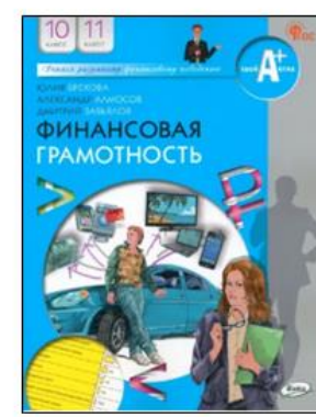
Авторы 10,11: Брехова Ю. , Алмосов Д. , Завьялов Д.