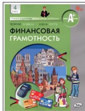
Авторы 4: Гловели Г. , Гоппе Е.