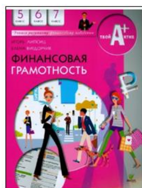
Авторы 5-7: Липсиц И. , Вигдорчик Е.