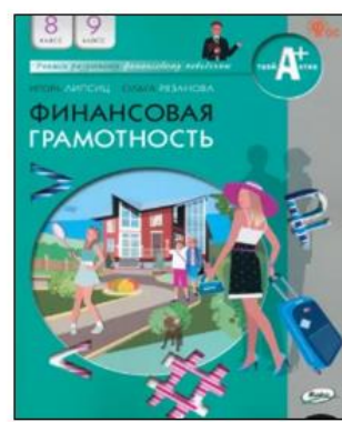
Авторы 8,9: Липсиц И. , Рязанова О.