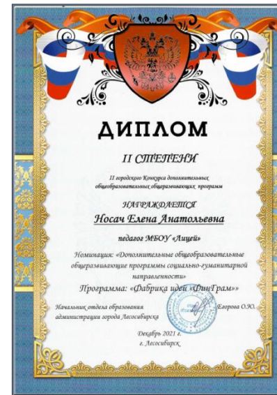
Городской конкурс дополнительных программ: «Фабрика идей «ФинГрам»