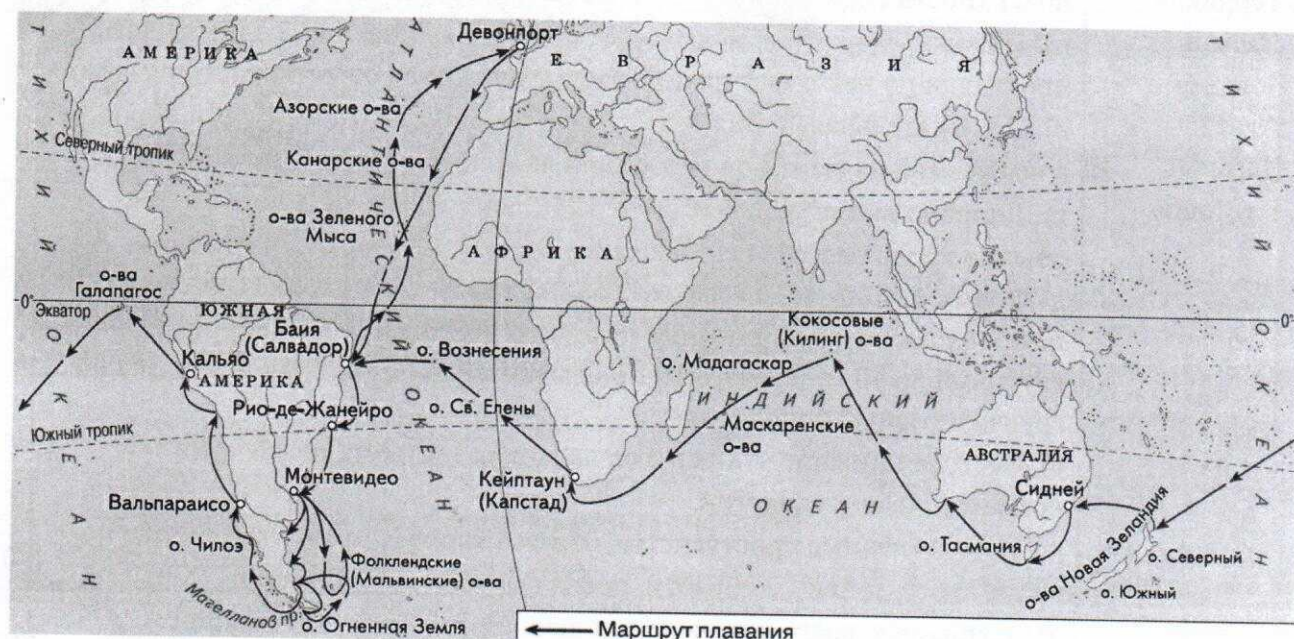
Таблица 8.2 Максимальное количество баллов - 26